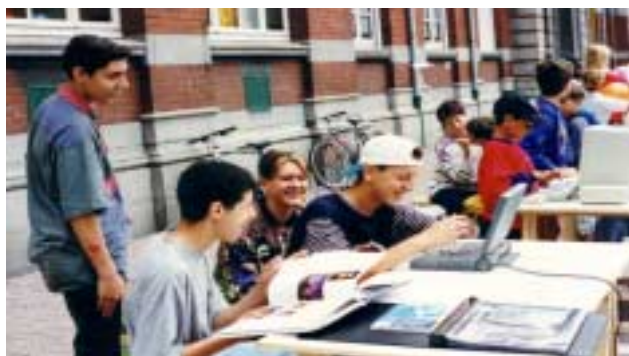
ATD Quart Monde

Certains ne s'y trompent pas, comme cette femme intervenant dans une université populaire Quart Monde 1 en 2000 : « [Internet, c'est] l'avenir, parce que cela permettra de trouver des emplois, cela en créera des nouveaux parce que certains employeurs sont connectés sur Internet. On peut faire ses courses. Cela facilite les démarches administratives (ex : pour les impôts). Ce sera plus facile pour ceux qui sont malades ou handicapés qui ne peuvent pas sortir de l'hôpital. On peut communiquer avec d'autres pays. C'est bien pour les enfants, pour leur culture, pour les médecins. C'est assez vaste l'Internet, il y a beaucoup de choses. »