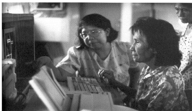
Manille – Philippines

L'ambition portée par de nombreux acteurs d'une société de l'information pour tous s'accorde avec la réalisation des Objectifs du Millénaire 4 , dont fait partie la lutte contre la pauvreté, et les politiques d'e-inclusion développées par plusieurs participants au Sommet.